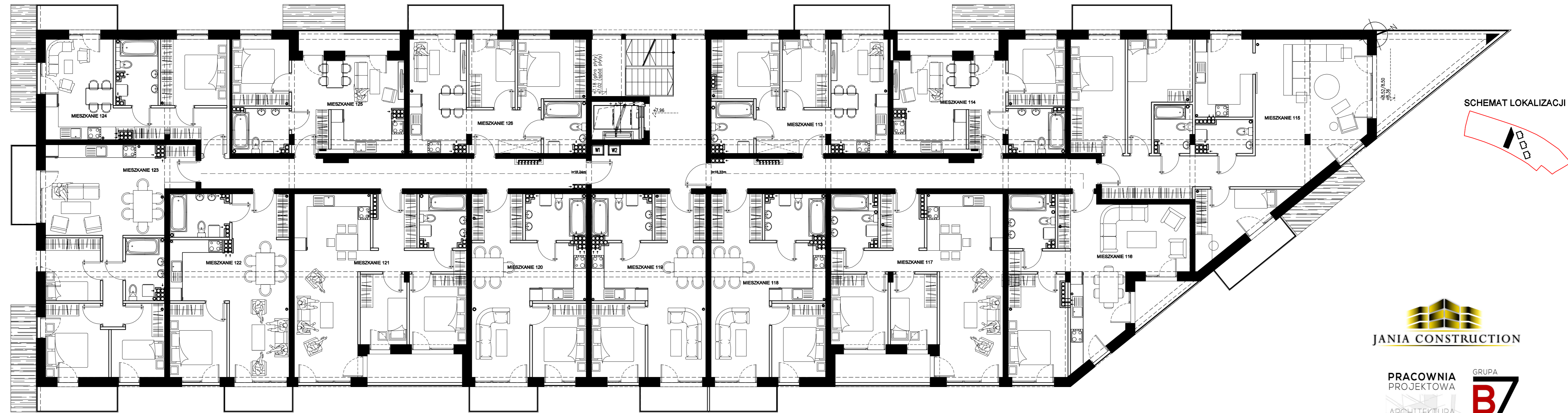
RZUT II PIĘTRA ETAP I BUDYNEK D Budynek mieszkalny wielorodzinny